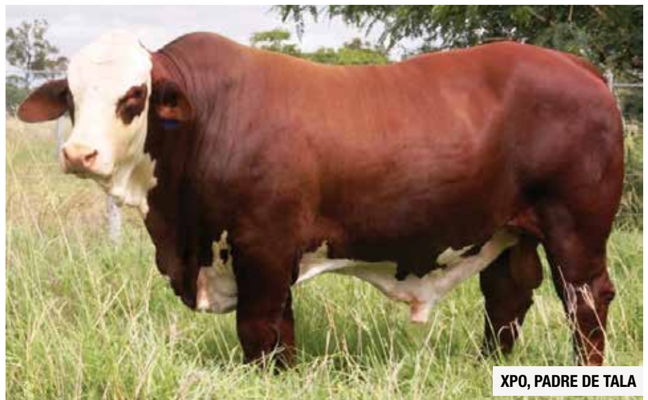
XPO, PADRE DE TALA

Sus cualidades carniceras y estructura ósea lo hacen un individuo muy interesante para la raza Braford y el mejoramiento de los plantales. Además posee una caracterización racial y pigmento muy deseable.