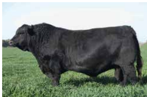
Conhelo (abuelo materno de Pionero)