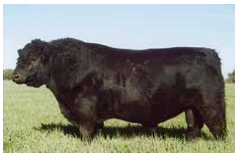
Lider (padre de Azafrán)

Azafrán, destacado hijo de Lider , muy balanceado, con muy buenas masas musculares, excelente línea de lomo, largo y de buena costilla. Gran apertura de sangre en su línea materna convirtiéndolo en una imperdible alternativa para combinar crecimiento, musculatura y engrasamiento.