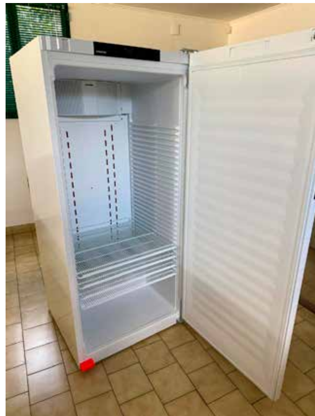
Nueva Cámara climatizadora para nuestro laboratorio