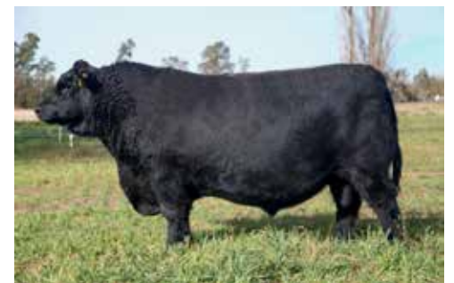
Mayaco 473 (padre de pionero)